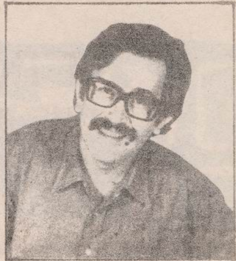
ANDRES PASCAL ALLENDE SECRETARIO GENERAL DEL MIR