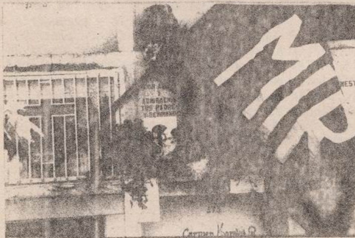
LA BANDERA EN LA TUMBA DE MIGUEL