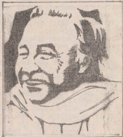
LUIS CORVALAN LEPE SECRETARIO GENERAL DEL PC

Partido Comunista de Chile Comisión Política