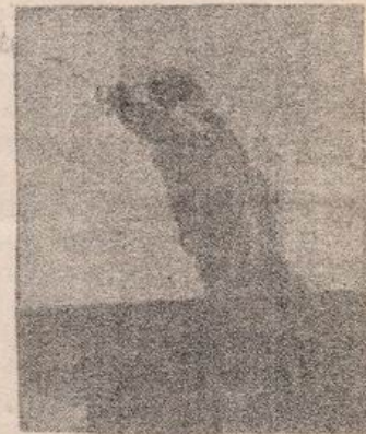
DESDE EL TECHO DE LA U: DURO A LOS PACOS

Varias poblaciones de zona sur -J.M. Caro, La Victoria, Sta. Adriana, La Bandera, Sta. Olga, Pablo de Rokha- estuvieron totalmente bloqueadas por barricadas desde la mañana. Apoyados por brigadas milicianas y de autodefensa, cientos de pobladores expropiaron locales comerciales y marcharon por el interior de sus localidades, adueñándose de ellas. El cuartel de pacos de La Victoria fue cercado y atacado por un millar de pobladores. En Pudahuel hubo paros en Fanaloza, Cecinas Vi-